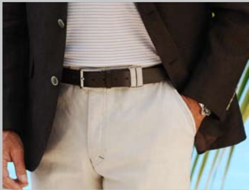
TROUSERS DESIGNED TO RELAX